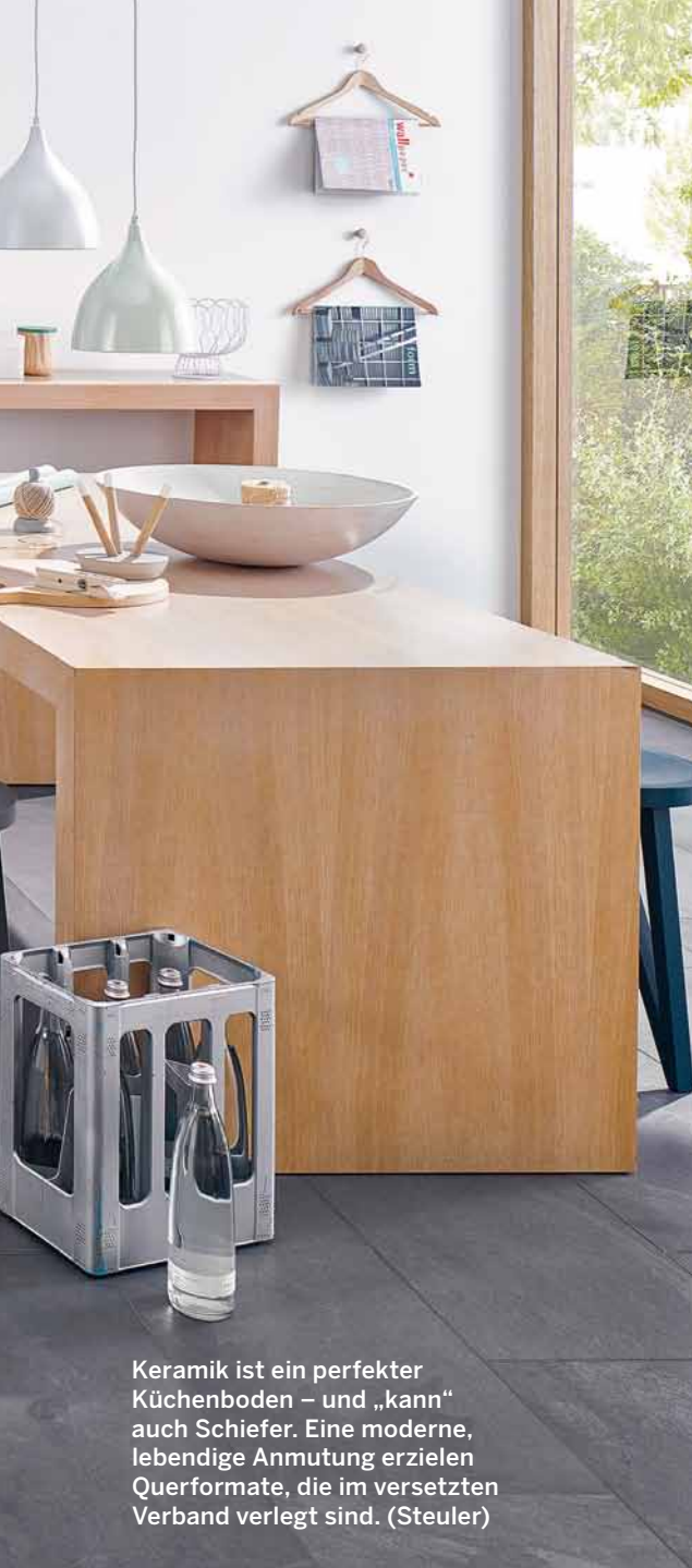
Keramik ist ein perfekter Küchenboden – und „kann“ auch Schiefer. Eine moderne, lebendige Anmutung erzielen Querformate, die im versetzten Verband verlegt sind. (Steuler)