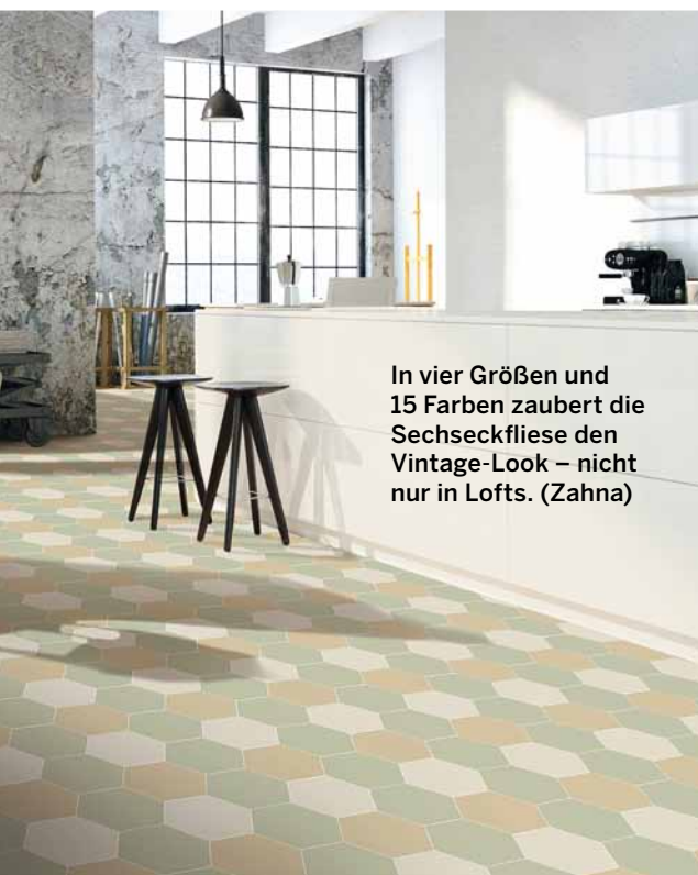
In vier Größen und 15 Farben zaubert die Sechseckfliese den Vintage-Look – nicht nur in Lofts. (Zahna)

F liesen sind geradezu unverwüstlich. Man erneuert sie daher längst nicht so häufig wie die Tapete oder den Teppichboden. Fliesentrends fallen also eher dezent und klassisch aus als modisch und aktuell. Ihr Design zeichnet sich aus durch zeitlose Schönheit dezenter strukturierter Oberflächen. Der Trend geht weiterhin zu Groß- und Querformaten sowie zu Naturstein und Holzoptik. Mit wohnlicher Ausstrahlung und hohem Nutzungskomfort erobern die aktuellen Bodenfliesen den Wohnbereich.