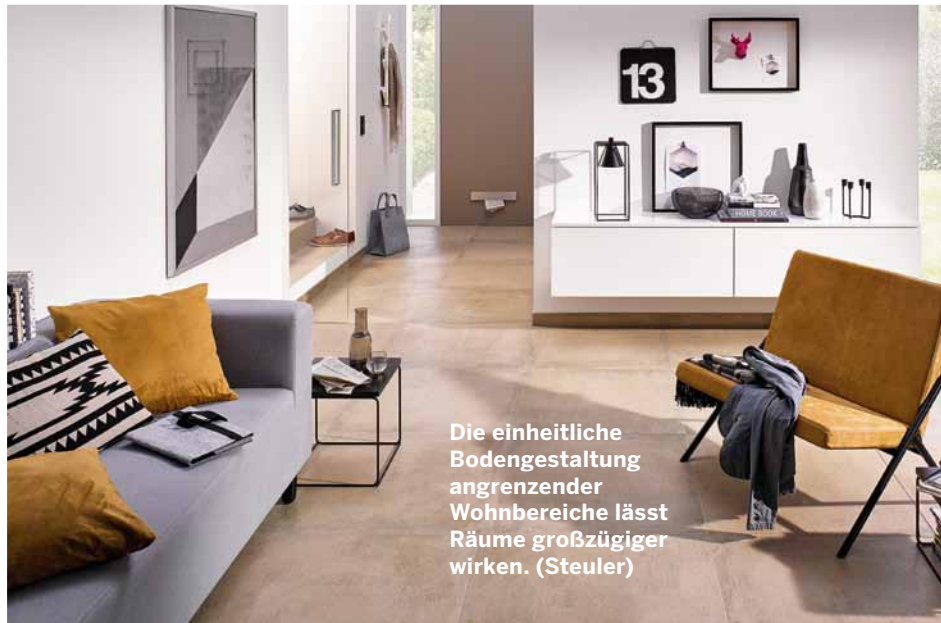
Die einheitliche Bodengestaltung angrenzender Wohnbereiche lässt Räume großzügiger wirken. (Steuler)