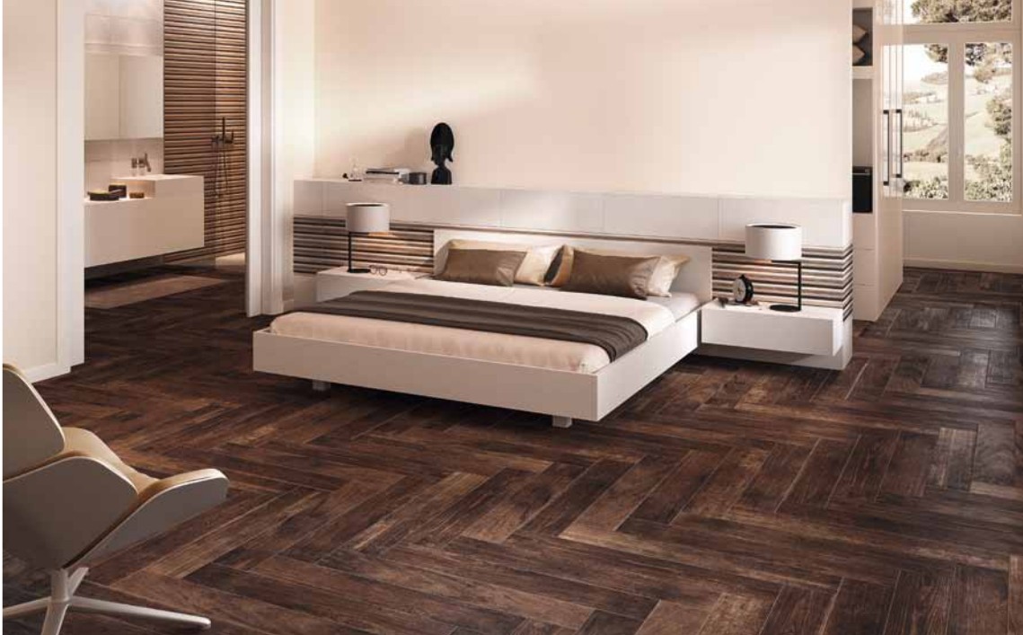
Großzügige Raumwirkung dank durchgehendem Bodenbelags: Die im Parkettlook verlegte Fliese in Holzoptik ist feuchtigkeitsunempfindlich und daher auch ideal im Bad. (Engers)

Belagsmaterial, das die Wärme fast verlustfrei und rasch an die Fußbodenoberfläche leitet. Und last not least: Fliesen sind robust und pflegeleicht.