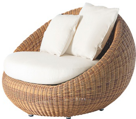
RELAXEN „Bubble Lounge Chair“ von Point, ca. 1.065 Euro. Über Villa Schmidt, www.villa-schmidt.de