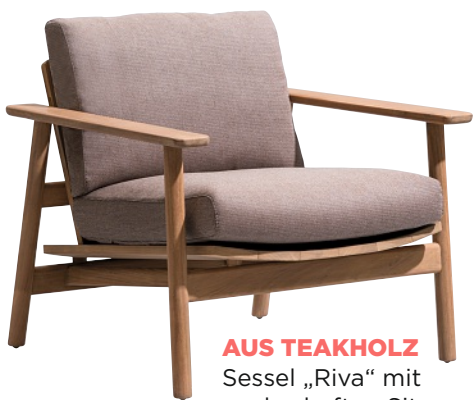
AUS TEAKHOLZ Sessel „Riva“ mit zauberhaften Sitzpolstern, ca. 1.995 Euro. Von Kettal, www.kettal.com