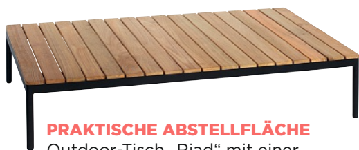
PRAKTISCHE ABSTELLFLÄCHE Outdoor-Tisch „Riad“ mit einer Platte aus Teakholz, ca. 995 Euro. Von Oasiq, www.oasiq.com