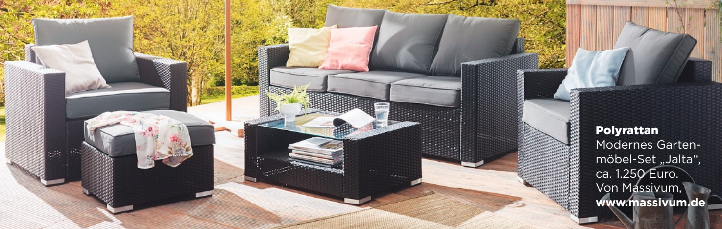
Polyrattan Modernes Garten- möbel-Set „Jalta“, ca. 1.250 Euro. Von Massivum, www.massivum.de