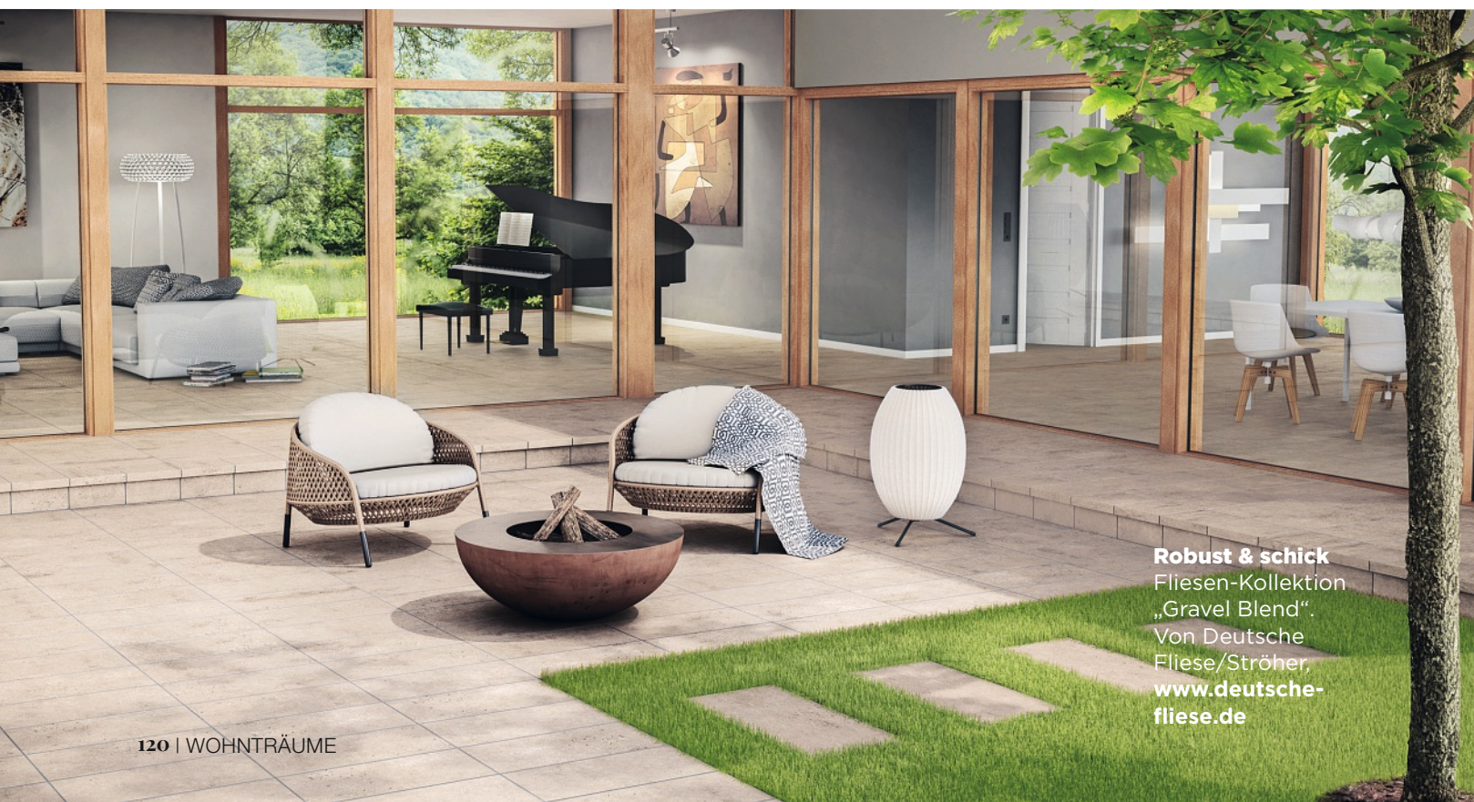
Robust & schick Fliesen-Kollektion „Gravel Blend“. Von Deutsche Fliese/Ströher, www.deutsche-fliese.de

TEXT Michaela Richter INTERVIEW Richard Kerler