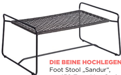
DIE BEINE HOCHLEGEN Foot Stool „Sandur“, ca. 450 Euro. Von Oasiq, www.oasiq.com