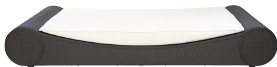
FÜR SCHLUMMERSTUNDEN Daybed „Sitting Bull“ für draußen, ab ca. 5.800 Euro. Von Lambert, www.lambert-home.com