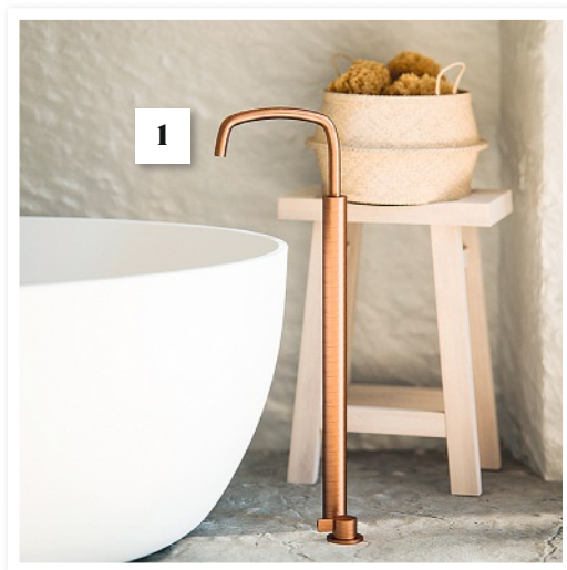
1 Bodenmontierte Kupfer-Wannenarmatur (Cocoon, www.bycocoon.com ). 2 Mit der Fliesenserie „Trias“ setzen Sie Natursteinakzente im Bad (Deutsche Fliese / Agrob Buchtal, www.deutschefliese.de ). 3 Armatur „Tara“ wurde von Sieger Design entworfen. Regenduschen bieten Entspannung pur. (Dornbracht, www.dornbracht.com/de ).