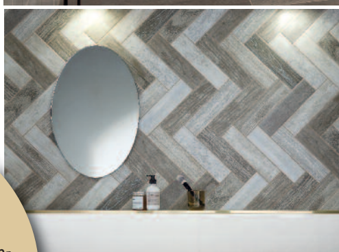
◀ ▲ Bodenfliese "Driftwood" (z. B. in 25 x 100 cm oder 30 x 120 cm) verbreitet den rustikalen Charme von Holz, das lange Zeit der Witterung ausgesetzt war. Das Highlight an der Wand: Riegel-Dekor "Cabana" (aus der Serie "Mando") in klassischem Fischgrätmuster.