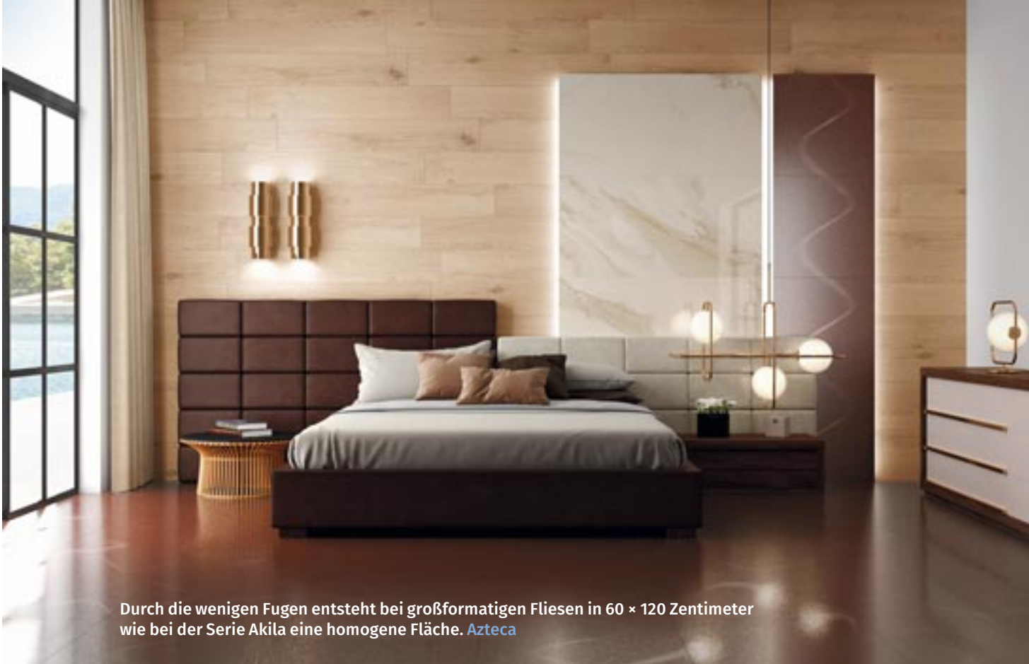
Durch die wenigen Fugen entsteht bei großformatigen Fliesen in 60 × 120 Zentimeter wie bei der Serie Akila eine homogene Fläche. Azteca