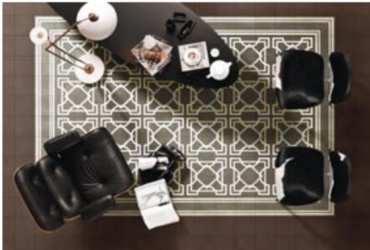
Die Verlegung der Zementfliesen I Fregi erinnert an einen abgepassten Teppich. Eine Bordüre rahmt die elegante Einrichtung mit Möbelklassikern. Bisazza