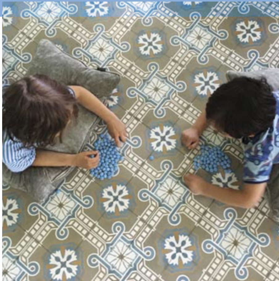
Die beiden sind ganz vertieft in ihr Perlenspiel. Auf dem Boden liegen historische Zementfliesen mit floralem Muster. Viaplatten

Mehr Info www.zuhause3.de/ wohnen-und-design