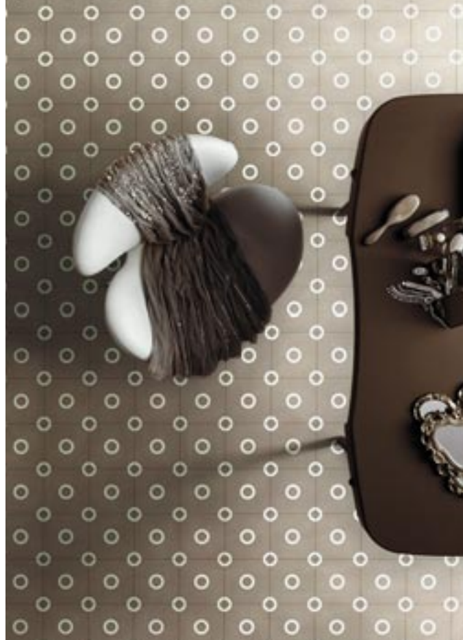
Sehr feminin wirken die Zementfliesen Mould Castago mit dem Pünktchendekor. Bisazza