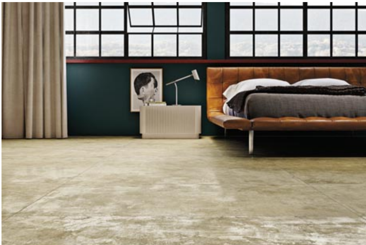
Täuschend echt imitiert die großformatige Bodenfliese Homebase in 60 × 120 Zentimeter einen Estrichboden. Ihr Vorteil: Sie lässt sich viel besser reinigen. Steuler