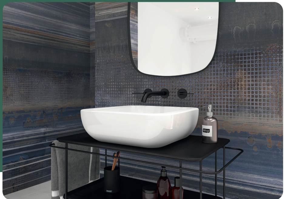
► „Seahouse“ von Interbau-Blink

kulinen Look ins Bad. Das Fliesendesign greift diese Strömung, die mit dem Industrial Style verwandt ist, mit metallisch wirkenden Oberflächen oder Rosteffekten auf. Perfekte Kontraste erzielen glänzende Textilien wie Samt oder Brokat, dunkles Holz oder der urbane Ausdruck von Beton.