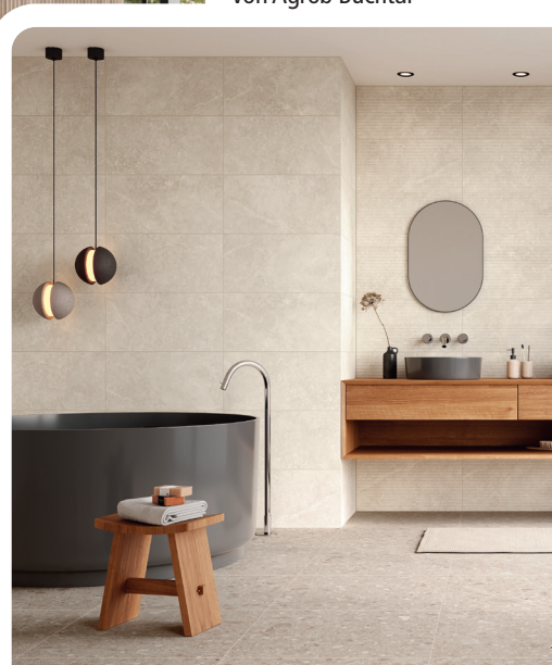
▼ „Stone Concept“ von Agrob Buchtal