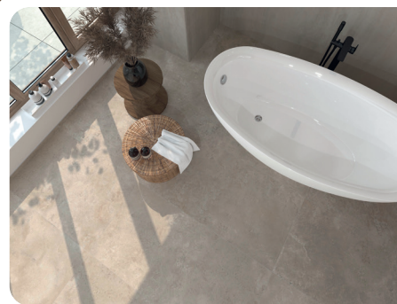
▲ „Laguna“ von Interbau-Blink

Passend zum Farbtrend „Mocha Mousse“, der Pantone-Farbe des Jahres, bringen Sand-, Stein- und Erdtöne eine warme Atmosphäre ins Bad. Ein ebenso zeitloser Farbtrend ist „Greige“ – ein Mix aus beige und grau. In den aktuellen Fliesenkollektionen finden sich zahlreiche Natursteindekore, aber auch Beton- und Estrichanmutungen in Sand- und Beigetönen. Für Funktionsbereiche wie den Waschplatz oder hinter der Badewanne bieten sich Vollformat-Dekore an. Gefragt sind oft dreidimensionale Strukturen, die häufig Ton-in-Ton zur Grundfliese gehalten sind.