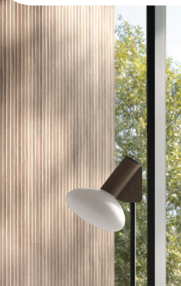
◀ „Nexos“ von Gepadi