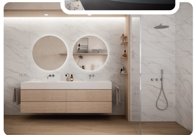
▲ „Bliss“ von Agrob Buchtal